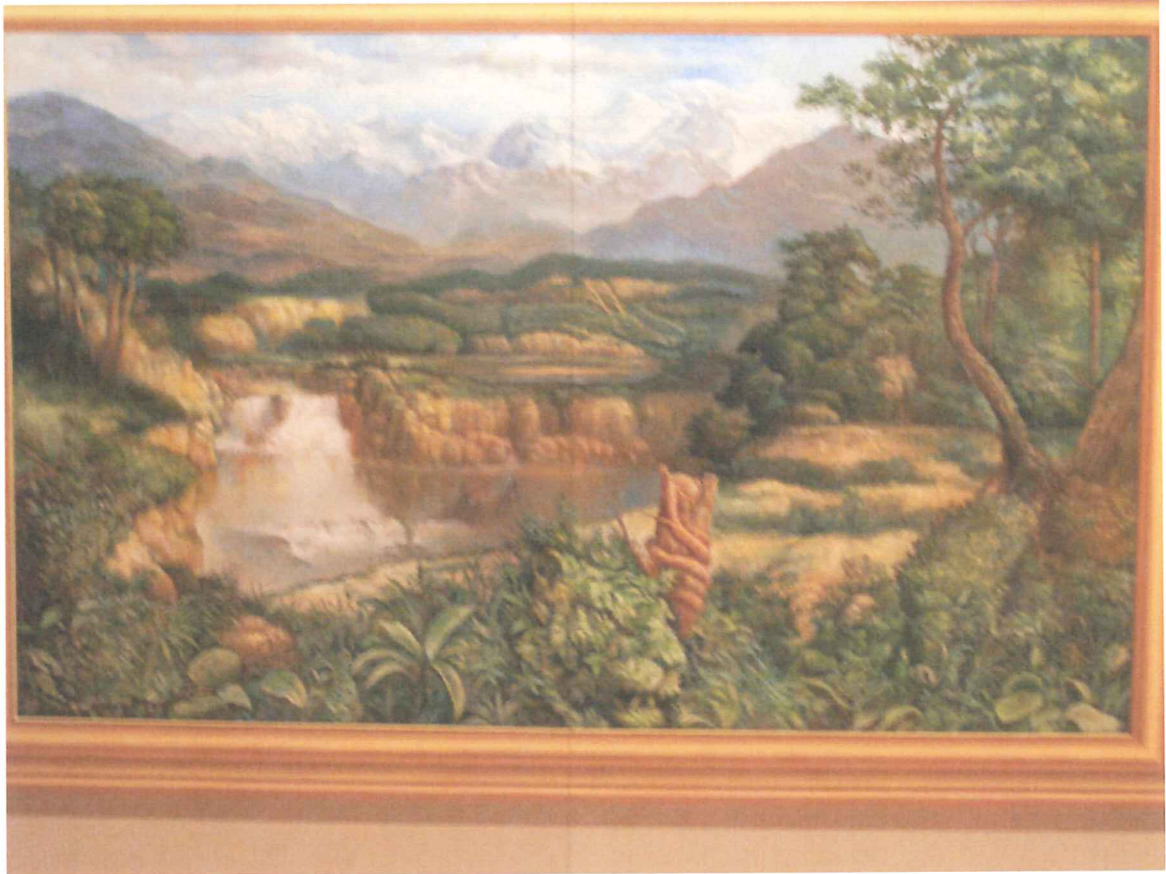
十二支が隠れていますよ (^-^)