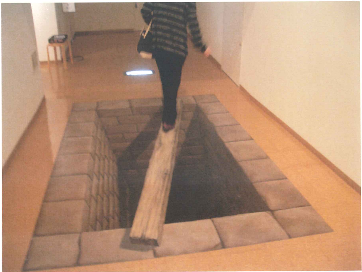
落ちずに渡れるかな!?(・・;)